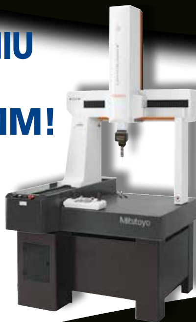
CRYSTA-Apex V 544

Zakres pomiarowy: x: 500 mm y: 400 mm z: 400 mm